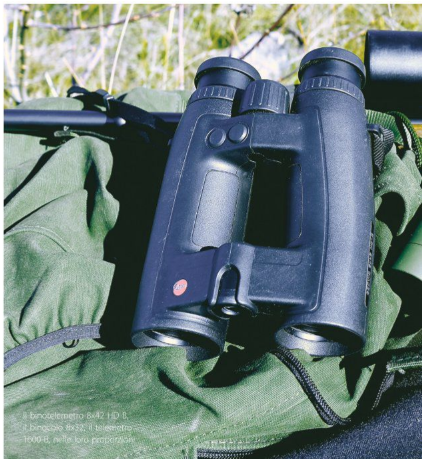
Il binotelesmetro 8x42 HD B, il binocolo 8x32, il telemetro 1600 B, nelle loro proporzioni